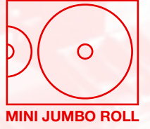
MINI JUMBO ROLL

TS55-1800, "sınıfındaki ilk" olan opsiyonel mini jumbo besleme ünitesiyle, pazar dengelerini alt üst eden bir fiyat/performans verimliliği sunuyor. Tek ruloda 2500 metre uzunluğundaki Mimaki Vision Jet-X kaplamalı transfer kağıdı (57g/m 2 ) ve 10 litrelik boya tanklarının kombinasyonu ile kendi segmentinde verimlilik algısını tümünden değiştirecektir.